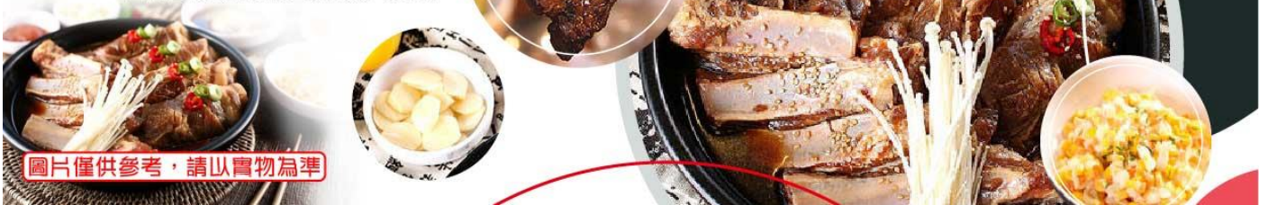
圖片僅供參考，請以實物為準