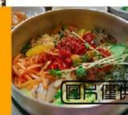
圖片僅供參考，請以實物為準