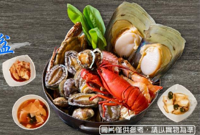
圖片僅供參考，請以實物為準