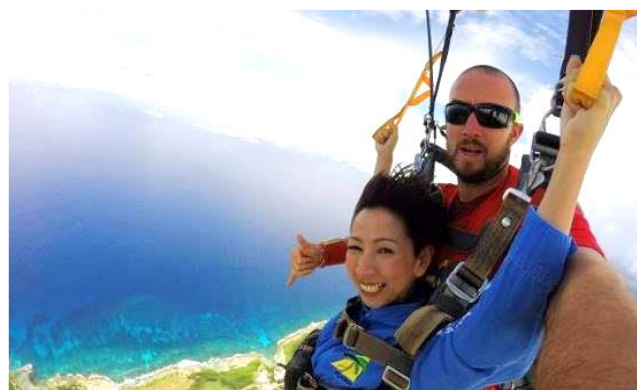
挑戰無限，高空飛行跳傘

尖叫後，轉身背向天空，俯瞰蔚藍海、翠綠地與白晳環礁產生美對比，此時教練展開飛行傘滯留空中，滑翔獨享這片感動。但能跳這一次，就夠回味一輩子，對於天空您將不會再有什麼遺憾了！