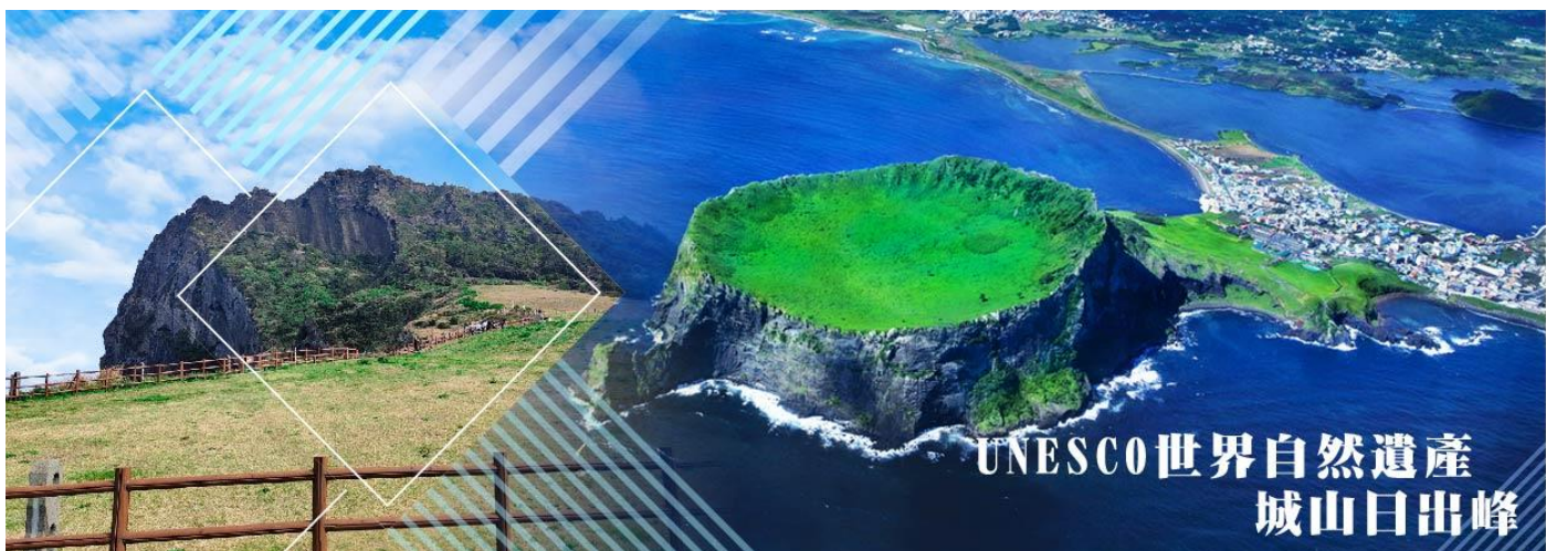
UNESCO世界自然遺產 城山日出峰